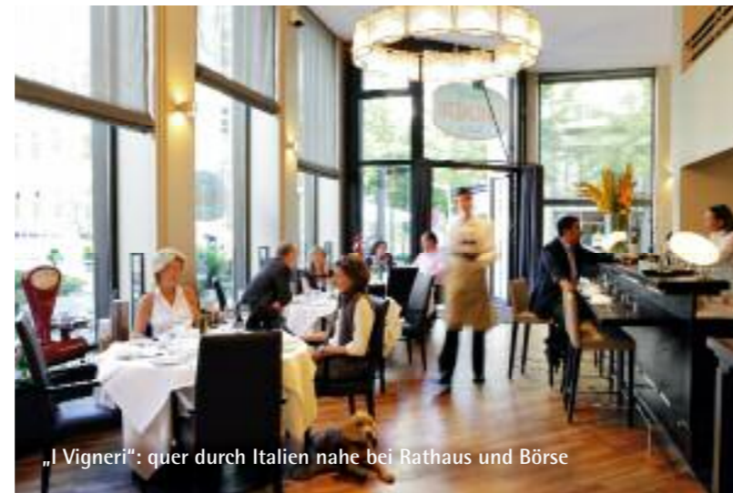
„I Vigneri“: quer durch Italien nahe bei Rathaus und Börse

Weiterhin zu empfehlen ist auch das stets rummelige, weil gut besuchte „Henssler Henssler“ ( www.hensslerhenssler.de ), das zwar auf der falschen Seite der Großen Elbstraße steht, ohne Hafeblick in einem ehemaligen Lagerschuppen, aber Fernsehkoch Steffen Henssler macht den Standortnachteil mit seiner schmackhaften Pazifikküche mehr als wett.