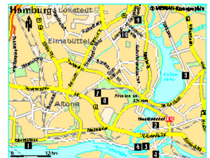
Die Erklärung unseres Bewertungssystems steht auf Seite 119

FR OT Hoheluft-Ost, Klosterallee 100, Tel. 040-46 77 78 68, www.wilder-kaiser.co , kein Ruhetag, Hauptgerichte € 13-29 EC Master Visa M T