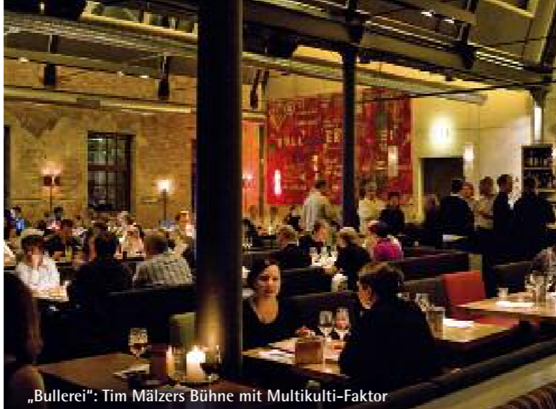
„Bullerei“: Tim Mälzer's Bühne mit Multikulti-Faktor

FR OT Speicherstadt, Am Sandtorkai 23/24, Tel. 040-33 47 53 75 11, www.vlet.de , Sa mittag, So geschl., Hauptgerichte € 16-28 AmEx EC Master Visa M T