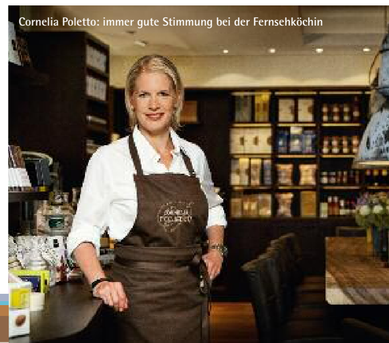
Cornelia Poletto: immer gute Stimmung bei der Fernsehköchin

„In Österreich und im gesamten Alpenraum wird für den Gaumen gekocht und aufgetischt, nicht für den schönen Schein“, steht auf der Speisekarte. Eine durchaus richtige Be-