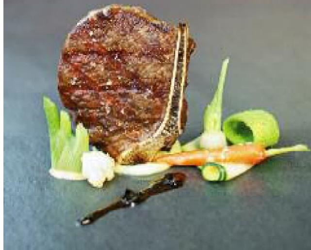
„River Grill“: special cuts mit Gemüse aus der Region