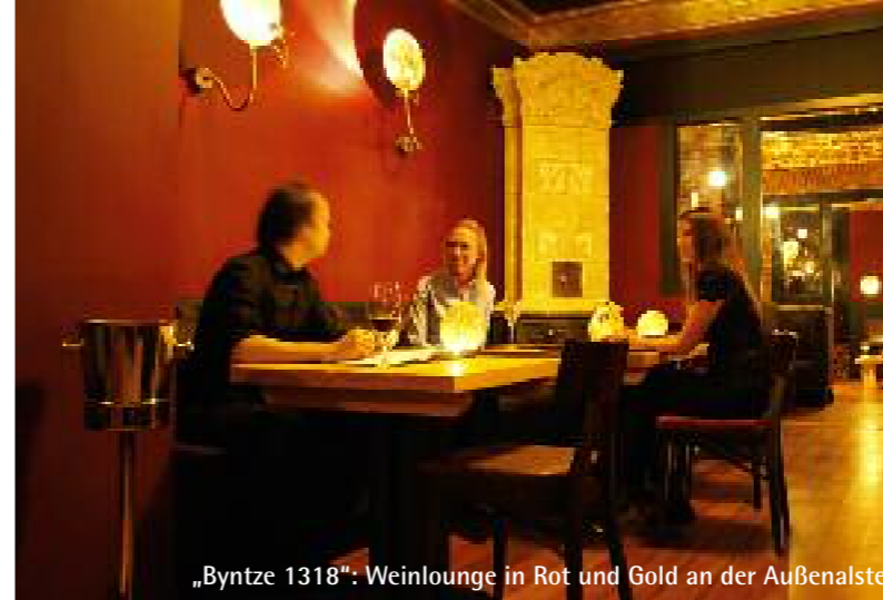
„Byntze 1318“: Weinlounge in Rot und Gold an der Außenalster

Die Ziffern 1 bis 6 beziehen sich auf die Karte auf Seite 37